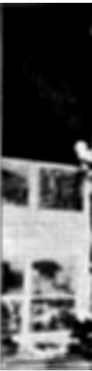
Lavori artistici realizzati dagli alunni