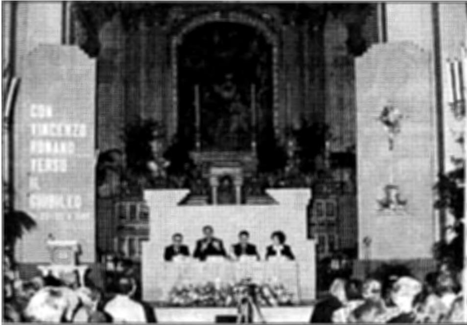
Basilica di S. Croce - 21 ottobre 1997. Il tavolo dei Relatori della prima serata del Convegno.